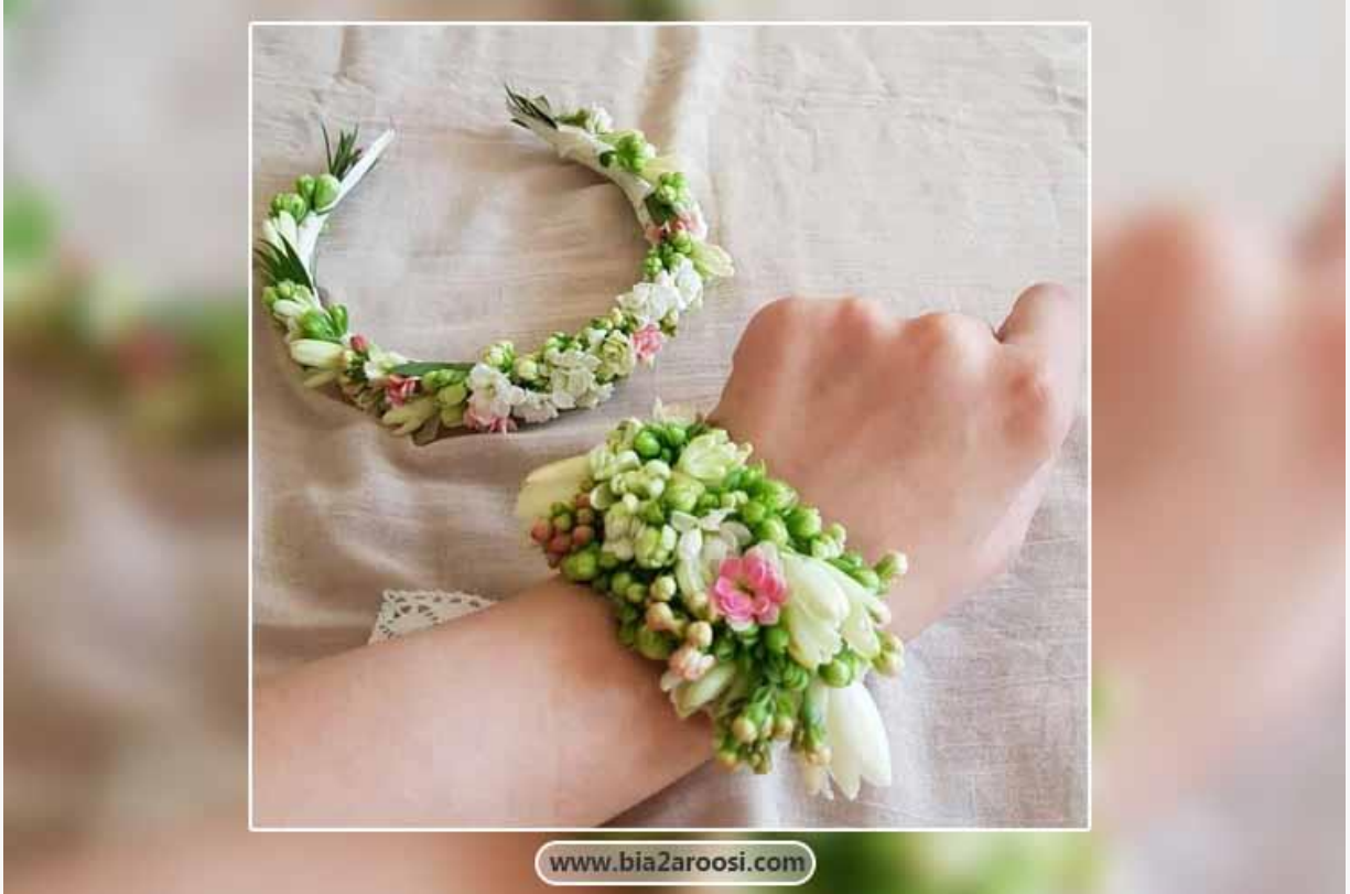
ست دستبند و تاج گل عروس

همانطور که در قبل هم ذکر شد، ست دستبند با رنگ لباس عروس نیز مهم است و نباید آن را فراموش کنید. اگر لباسی دارید که در قسمت سینه یا دامن گلدوزی شده، بهترین کار این است که از دستبند های گل به جای جواهرات استفاده کنید. کیف و کفش عروس نیز مهم است. معمولاً کیف و کفش ست عروس با توجه به مدل و رنگ لباس انتخاب می شوند و بد نیست که در این بین به تناسب آنها با دستبند و تاج گل عروس هم توجه داشته باشید.