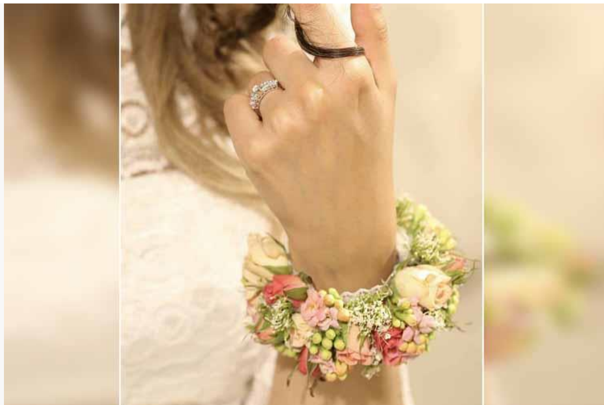
دستبند گل عروس شیک و زیبا